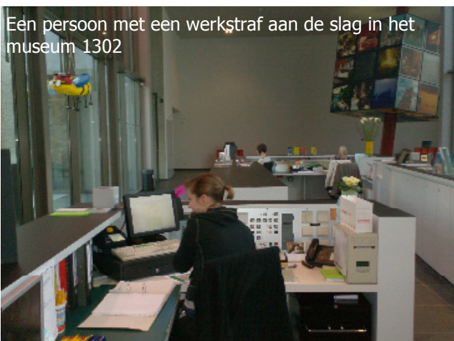
Een persoon met een werkstraf aan de slag in het museum 1302

Het belangrijkste is dat we op deze mensen kunnen rekenen. Dat ze er steeds zijn zoals afgesproken en dat ze de taken uitvoeren zoals afgesproken. Daarnaast is het belangrijk dat er een vertrouwen groeit want deze persoon krijgt toegang tot onze bureaus en allerlei documenten.